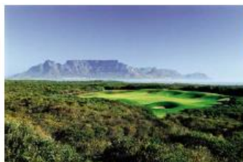
アトランティックビーチGC

◎南アフリカへの観光目的では査証不要。ただし旅券の残存が南アフリカ出国後30日以上、未使用査証欄が南アフリカ入国時2ページ以上必要です。