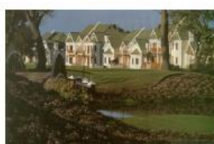
ファンコート・サウスアフリカ