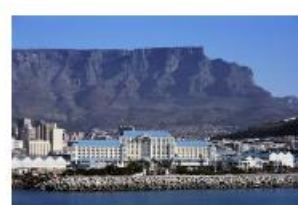
テーブルベイホテル