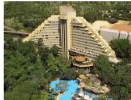
カスケイズホテル