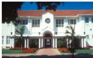
ビクトリアフォールズホテル

南アフリカゴルフとビクトリアの滝観光の10日間の旅をお楽しみください。プレーはミリオンダラートーナメントで有名なゲーリープレーヤーGC、女子ワールドカップ開催コースのファンコートリンクス等、南アのベスト5のコースでお楽しみいただけます。滞在は、現地での治安状況を考慮し、セキュリティのしっかりとした郊外型のデラックスホテルにご滞在いただけます。世界3台瀑布のひとつ、ビクトリアフォールズの観光も楽しみな旅行です。